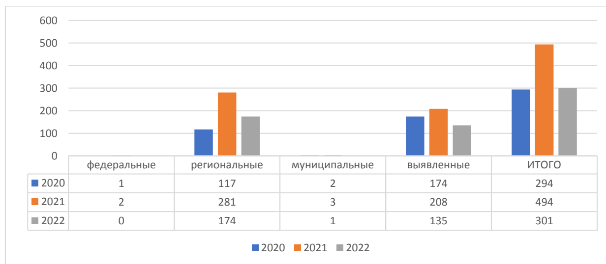
Рис.1 Количество обследованных объектов культурного наследия

В рамках мониторинга состояния объектов культурного наследия, расположенных на территории Республики Карелия (далее – ОКН), сотрудниками учреждения обследованы 301 объект культурного наследия, выявленный объект культурного наследия (приложение 2). В ходе проведенного в 2022 году совместно с органами местного самоуправления обследования и последующей обработки полученных данных уточнялись сведения о местоположении ОКН, техническом состоянии, наличии сведений о кадастровом номере объекта капитального строительства и земельного участка, о правообладателе объекта культурного наследия, о наличии информационных надписей и обозначений на объектах культурного наследия.